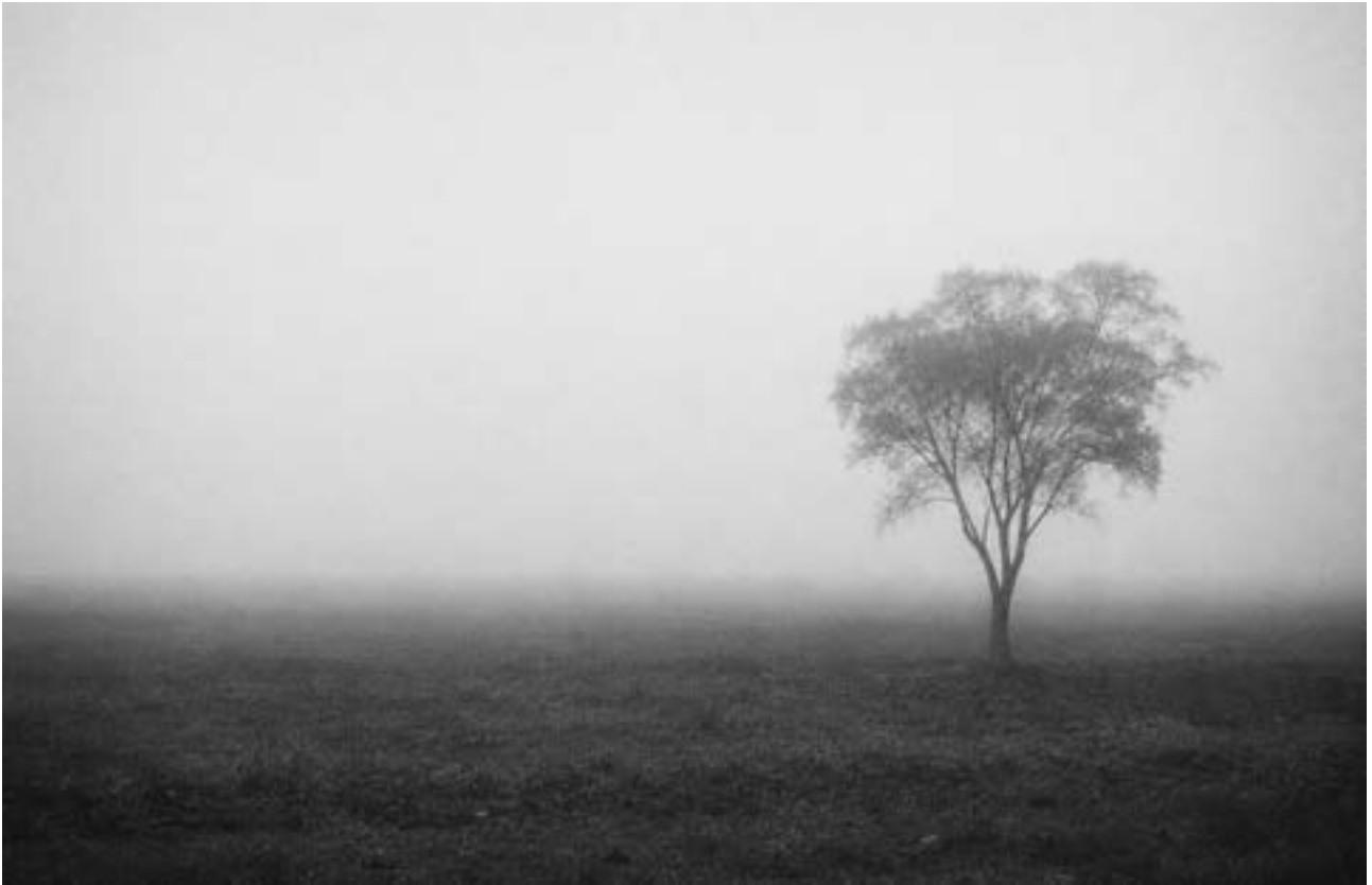
FIG. 01 — « Brume au matin, arbre seul » — image générée par IA (Text-to-Image)

Un paysage vide n'est pas vide. Il est plein de ce qu'on n'y voit pas. La photographie minimaliste — Sugimoto, Hamish Fulton, Michael Kenna — fait du silence visuel un sujet. Le brouillard, la neige, la mer plate : autant de manières de photographier le rien.